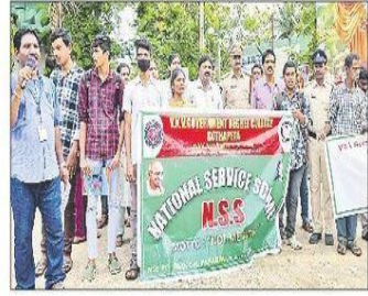
కొత్తపేటలో ర్యాలీ నిర్వహిస్తున్న అధ్యాపకులు, విద్యార్థులు