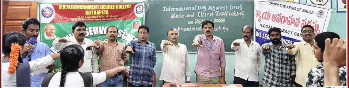
విశ్వకవి వేమన ప్రభుత్వ డిగ్రీ కళాశాల – కొత్తపేట

ప్రతిజ్ఞ నేను మాదకద్రవ్యాల వాడకాన్ని పూర్తిగా నిరాకరిస్తాను. డ్రగ్స్ వాడటం వల్ల కలిగే దుష్పరిణామాల గురించి అవగాహన కలిగి ఉంటాను. నా కుటుంబం, స్నేహితులు, సమాజాన్ని డ్రగ్స్ బారిన పడకుండా కాపాడేందుకు కృషి చేస్తాను. డ్రగ్స్ అమ్మే లేదా కొనుగోలు చేసే వ్యక్తుల సమాచారం పోలీసులకు తెలియజేస్తాను. డ్రగ్స్ రహిత జీవనశైలిని అనుసరిస్తాను. డ్రగ్స్ రహిత సమాజ నిర్మాణంలో నేను క్రియాశీలక భాగస్వామిగా ఉంటానని ప్రతిజ్ఞ చేస్తున్నాను..