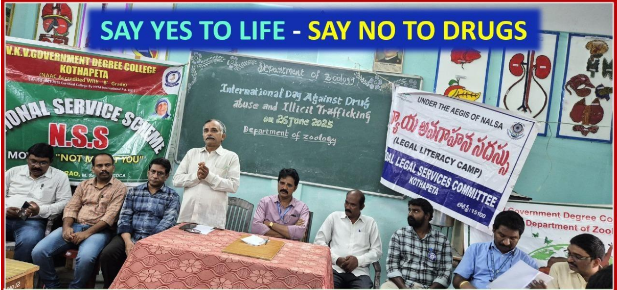
విశ్వకవి వేమన ప్రభుత్వ డిగ్రీ కళాశాల – కొత్తపేట

ప్రతిజ్ఞ నేను మాదకద్రవ్యాల వాడకాన్ని పూర్తిగా నిరాకరిస్తాను. డ్రగ్స్ వాడటం వల్ల కలిగే దుష్పరిణామాల గురించి అవగాహన కలిగి ఉంటాను. నా కుటుంబం, స్నేహితులు, సమాజాన్ని డ్రగ్స్ బారిన పడకుండా కాపాడేందుకు కృషి చేస్తాను. డ్రగ్స్ అమ్మే లేదా కొనుగోలు చేసే వ్యక్తుల సమాచారం పోలీసులకు తెలియజేస్తాను. డ్రగ్స్ రహిత జీవనశైలిని అనుసరిస్తాను. డ్రగ్స్ రహిత సమాజ నిర్మాణంలో నేను క్రియాశీలక భాగస్వామిగా ఉంటానని ప్రతిజ్ఞ చేస్తున్నాను..