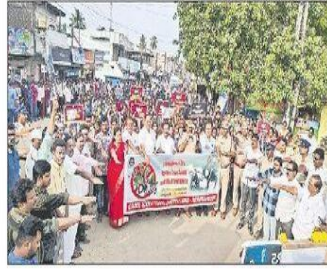
పి.గన్నవరంలో నిర్వహిస్తున్న ర్యాలీ