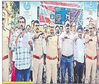
రాజోలులో ప్రతిజ్ఞ చేయిస్తున్న పోలీసులు, అధికారులు